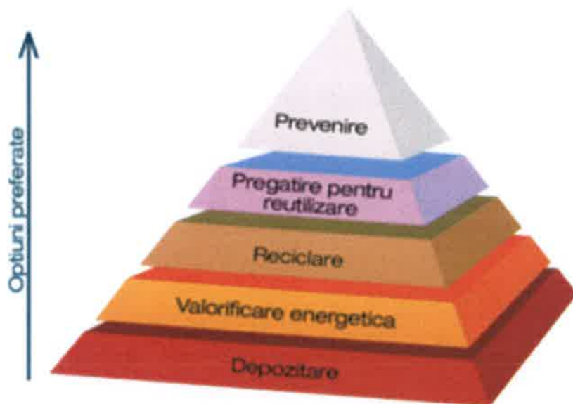
Fig.1 Piramida gestionării deșeurilor

Activitățile desfășurate trebuie să țină cont întotdeauna de o ierarhie a opțiunilor de gestionare a deșeurilor, conform fig. 1.